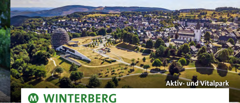
Aktiv- und Vitalpark