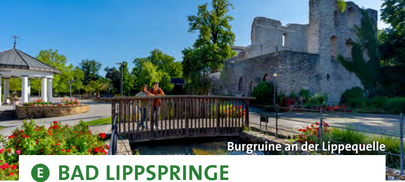
Burgruine an der Lippequelle

Die Wohlfühlstadt ist als Sole-Heilbad und Kneipp-Kurort doppelt prädikatisiert. Neben Gesundheitsexzellenz und einer interessanten Historie als Salzsiederstadt bietet Bad Salzuflen weitläufige Parklandschaften und eine lebendige Altstadt mit kleinen Boutiquen und Cafés. Ein besonderes Highlight sind die drei imposanten Gradierwerke. Dort genießen die Gäste Luft wie am Meer. Außergewöhnlich ist das begehbare Erlebnisgradierwerk mit Sole-Nebelkammer. www.staatsbad-salzuflen.de