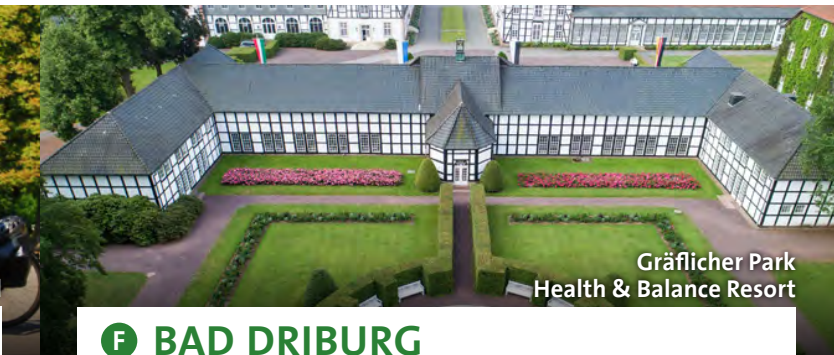
Gräflicher Park Health & Balance Resort

Neue Lebensfreude und Zufriedenheit – dazu verhelfen Ihnen Urlaubsangebote des lippischen Staatsbads. Es hat eine gut 200-jährige Heiltradition. Heute sind die Angebote auf die Gesundheit von Körper und Seele ausgerichtet. Die größte Yoga-Community außerhalb Indiens ist hier aktiv. Die Grundlagen der heilenden Wirkung liegen in der Natur, im Moor, im Heilwasser und in der herrlichen Landschaft rund um die Externsteine. www.hornbadmeinberg.de