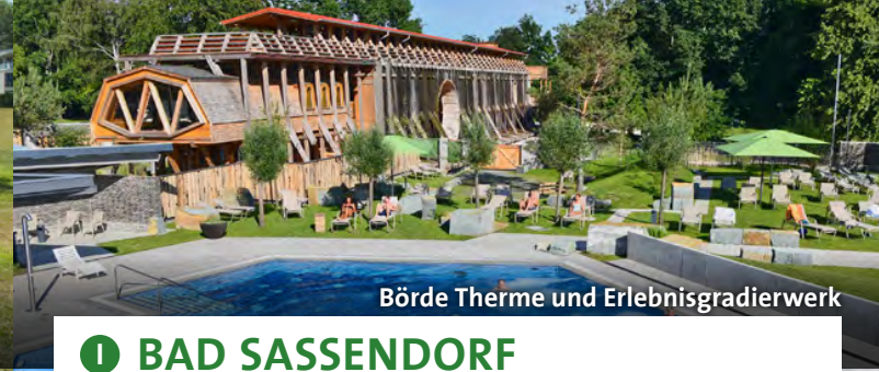
Börde Therme und Erlebnisgradierwerk

Ob unter den Schatten spendenden Bäumen des Kurparks, bei einer Massage in der Walibo Therme oder auf einer Radtour an Höfen, Wiesen und Wäldern entlang – Bad Waldliesborn lockt mit Entspannung. An heißen Tagen erfrischt Sie ein Spaziergang auf dem Nebelweg im Kurpark. Für Abwechslung sorgen Ausflüge in Lippstadts historische Altstadt oder zu den Lippeauen, die regionale Gastronomie und das vielseitige Veranstaltungsprogramm der Stadt. www.lippstadt-badwaldliesborn.de