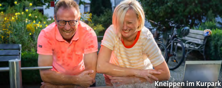
Kneippen im Kurpark